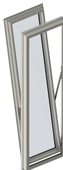
Gruppo Ulk per finestre Bottom-Hung (smoke vents)