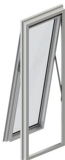
Gruppo Ulk per finestre Top-Hung

Il gruppo Ulk è composto da diversi componenti, tutti realizzati in acciaio inox: una coppia di cerniere, una coppia di bracci e una coppia di dispositivi di regolazione per la regolazione in altezza dell'anta quando Ulk è applicato su finestre Top-Hung.