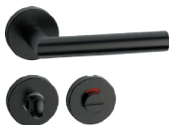
L14RWF52 Inox PVD GM