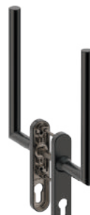
L14LD000 Inox PVD GM