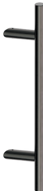
D25MS046-C0 (distancia entre ejes 300 mm) Inox PVD GM

Manillón individual con soportes desplazados