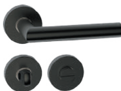
L14RWL52 Inox PVD GM