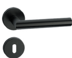
L14MRL52-31 Inox PVD GM