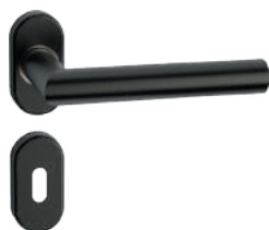
L14MRL09-31 Inox PVD GM