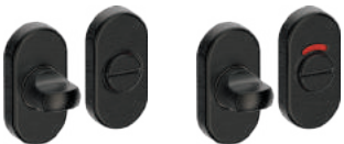
503NOL09 Inox PVD GM