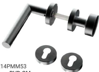
L14PMM53 Inox PVD GM