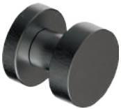
210PFL52 Inox PVD GM