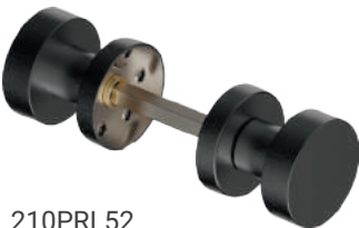
210PRL52 Inox PVD GM