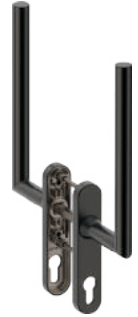
L14LD000 Inox PVD GM