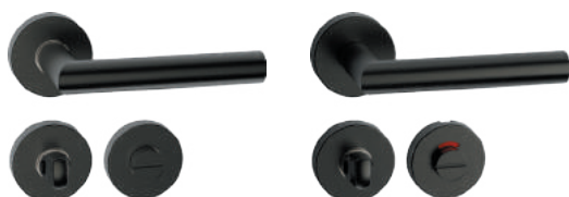
L14RWL52 Inox PVD GM