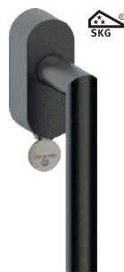
L14DKC80 Inox PVD GM