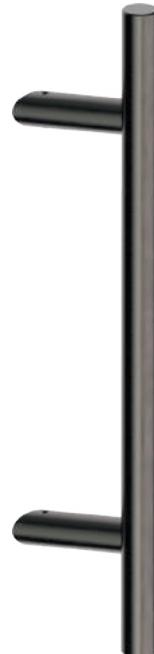
D25MS046-C0 (Lochabstand 300mm) Inox PVD GM