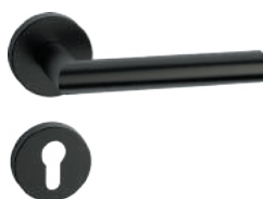
L14MRL52-32 Inox PVD GM