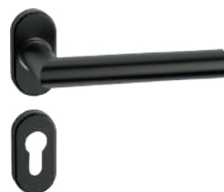
L14MRL09-32 Inox PVD GM